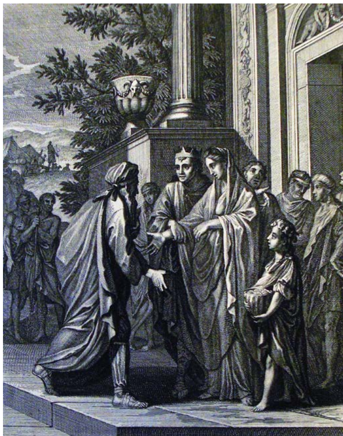
Abraham får tillbaka Sara av Abimelek. Caspar Lauyken, Wikipedia.

det synd. Och det blir inte mindre synd av att också den rättfärdige Noa har fallit i fällan. Den som gör sig skyldig till fylleri ska inte ärva Guds rike, står det i Gal 5.