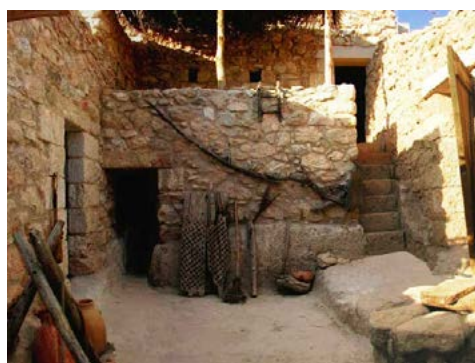
Så här kan det ha sett ut i Betlehem.