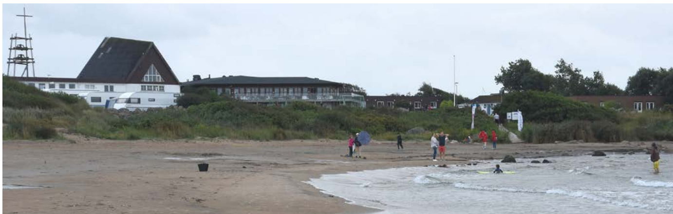
Strandgården i Halmstad är platsen för sommarlägret och konferensen 2–5 juli 2026.