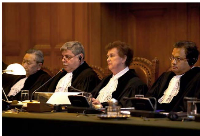
Internationella domstolen. Wikipedia

vet att det inte är någon idé att bygga ett hus på dålig grund. Du kan bygga hur fint som helst, men är grunden dålig så kommer tjälen att fördärva ditt hus den första vintern. Men är grunden god, ja då lönar det sig att bygga. Är Kristus grunden, ja då kommer också dina goda gärningar att följa med dig in i himlen. Detta talar Paulus om i 1 Kor 3, men vi ska inte säga mer om det nu.