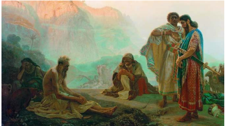
Job och hans vänner.

människor. Jesus sa till Nikodemus: Så älskade Gud världen att han utgav sin enfödde Son, för att var och en som tror på honom inte skall gå förlorad utan ha evigt liv (Joh 3:16). Aposteln Johannes skriver: [Jesus] är försoningen för våra synder, och inte bara för våra utan också för hela världens (1 Joh