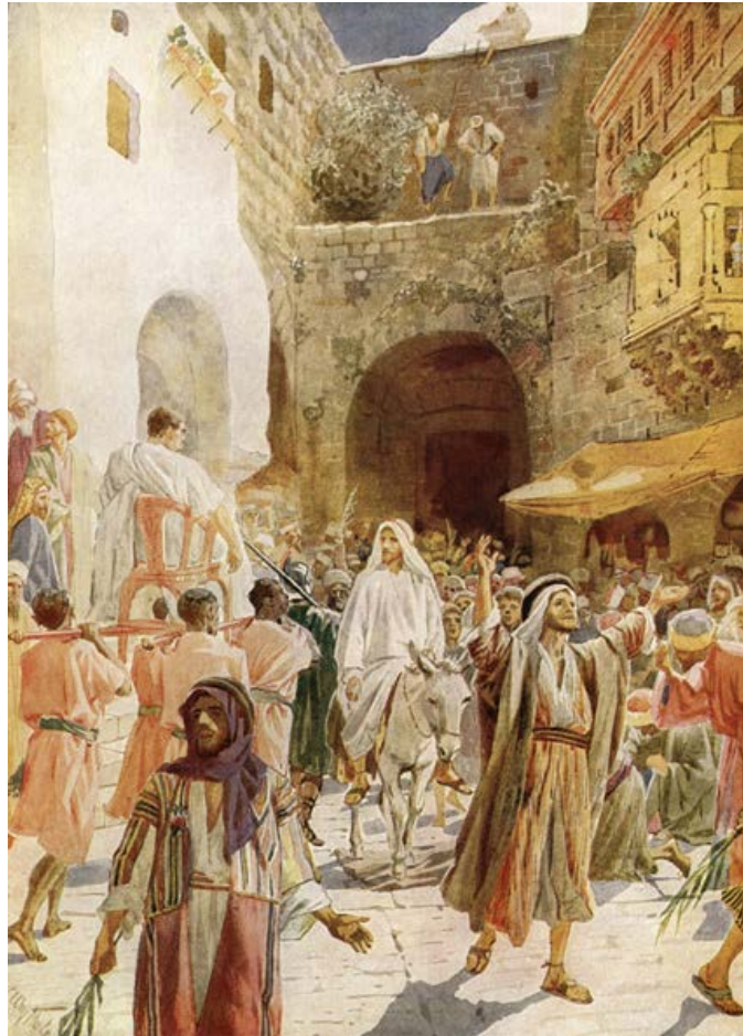
FRÅN HOLE: DET EVIGE MOTIV.

Vi syndar tyvärr ofta, även om vi tillhör den heliga kristna kyrkan. Vi faller i samma synd om och om igen. Och därför plågas vi i