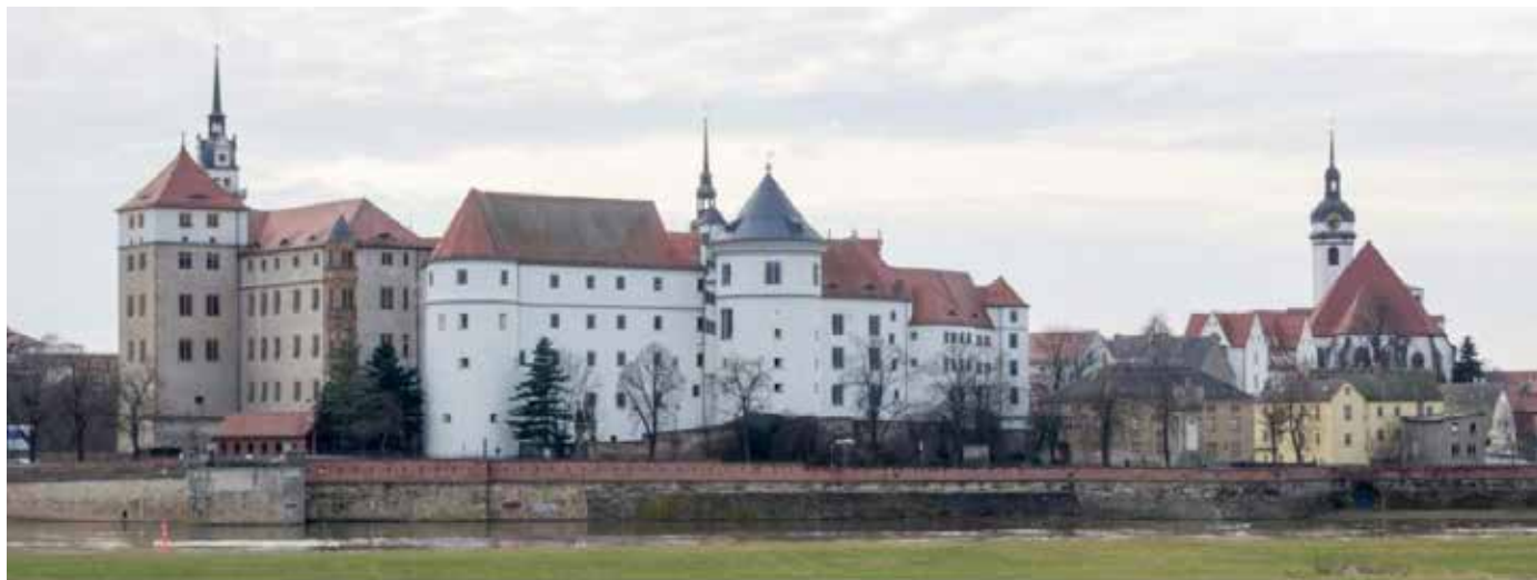
Torgau slott och stadskyrkan (till höger)