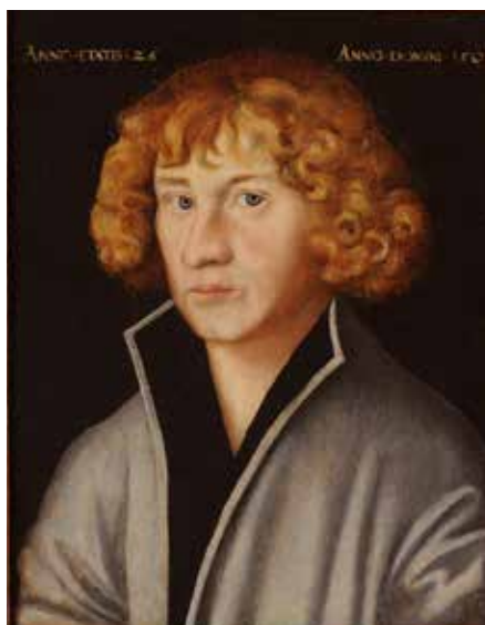
Georg Spalatin. Målning av Lucas Cranach

Georg Burkhardt, som han egentligen hette, föddes i staden Spalt nära Nürnberg i södra Tyskland. Det var som universitetsstudent i Wittenberg och Erfurt han började använda namnet Spalatin efter sin födelsestad. Den duktige unge mannen behärskade både grekiska och latin och kallades till Torgau som privatlärare. Där vann han kurfurstens förtroende och