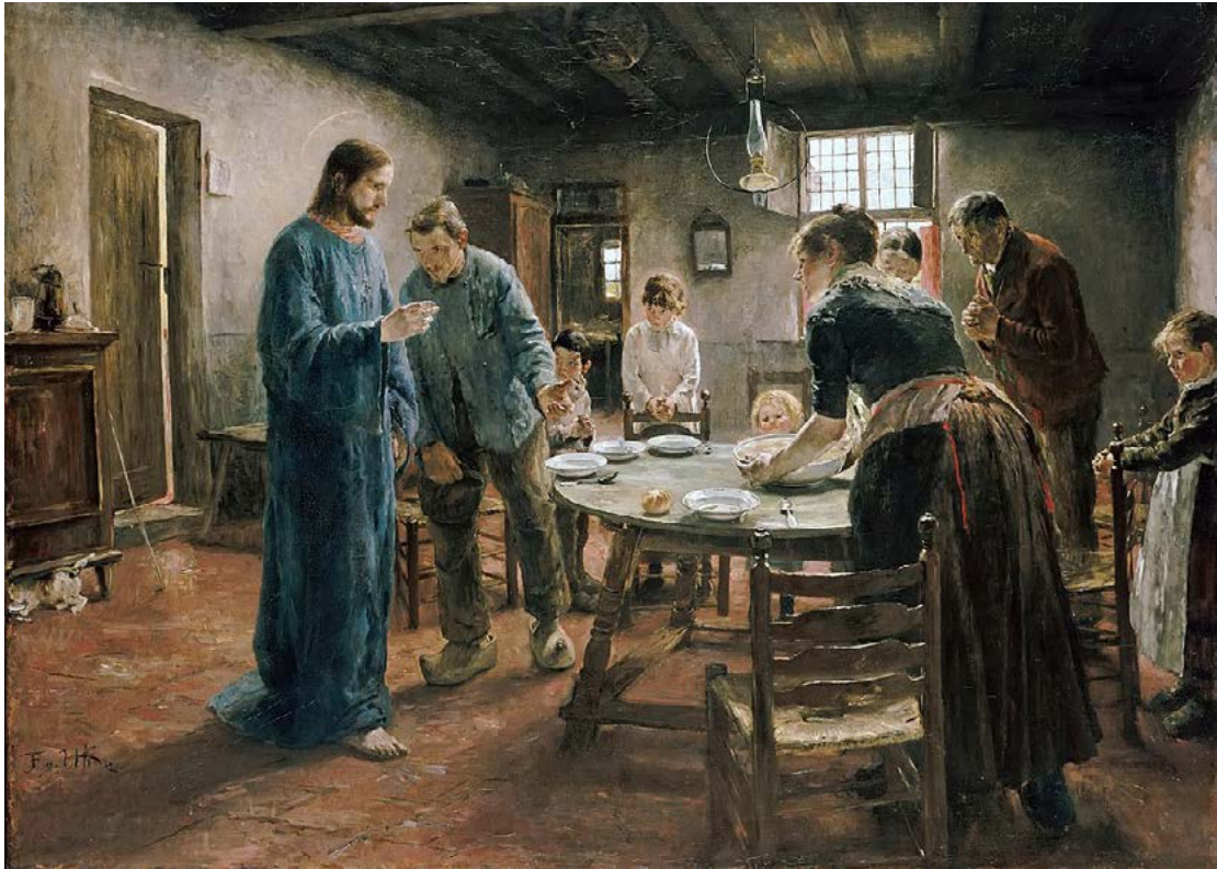
Das Tischgebet («Komm, Herre Jesu, sei unser Gast»), målad av Fritz von Uhde, 1885.

För några år sedan blev jag stående inför det här konstverket i Berlins gamla nationalgalleri. Bland annat eftersom det är ganska stort (165 cm brett, 130 cm högt) och mycket realistiskt kan åskådaren lätt få en känsla av att bli indragen och befinna sig i samma rum som personerna på bilden. Det gör ett mäktigt intryck, för vem är det som plötsligt har kommit in i en vanlig tysk bondfamiljs hus när de just ska sätta sig till bords för att äta? Det är ju Jesus! Mannen vid sidan om honom säger visst: "Kom och var vår gäst, Herre. Du kan sitta här." Jesus ska just leda familjen i en bordsbön.