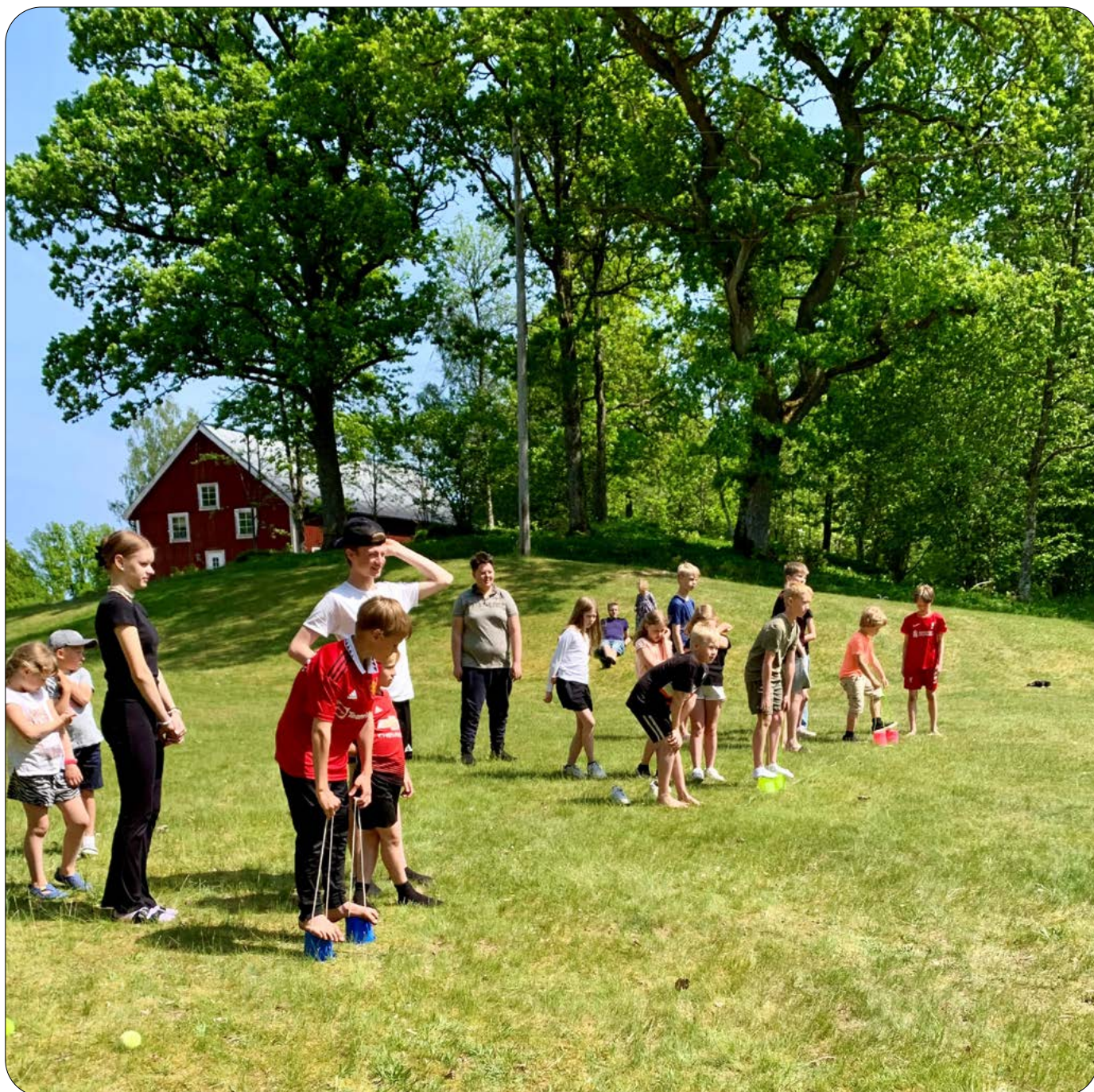
Lägerlekar på Sunnerbogården

NR 2 2023 – ÅRGÅNG 37. LUTHERSKA BEKÄNNELSEKYRKANS TIDNING