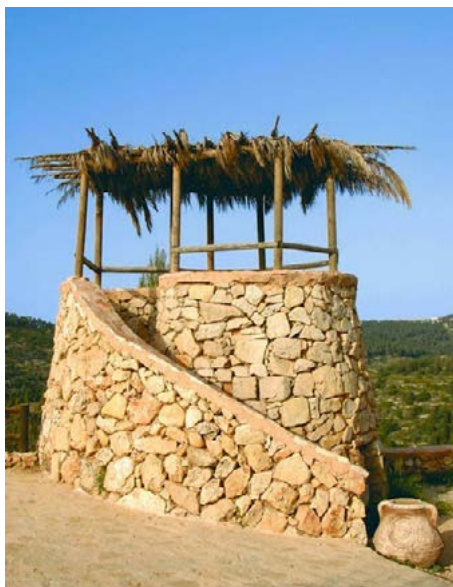
Jag ska stå på min vaktpost och ställa mig i tornet. Jag vill spana för att se (Hab 2:1)

I kapitel ett frågar profeten Gud: Varför griper du inte in och stoppar ondskan? En relevant fråga som kristna ställt i alla tider. De rättfärdiga lider ju under de ogudaktigas makt. Guds svar på detta är att han har full kontroll. Han håller på att mobilisera kaldé-