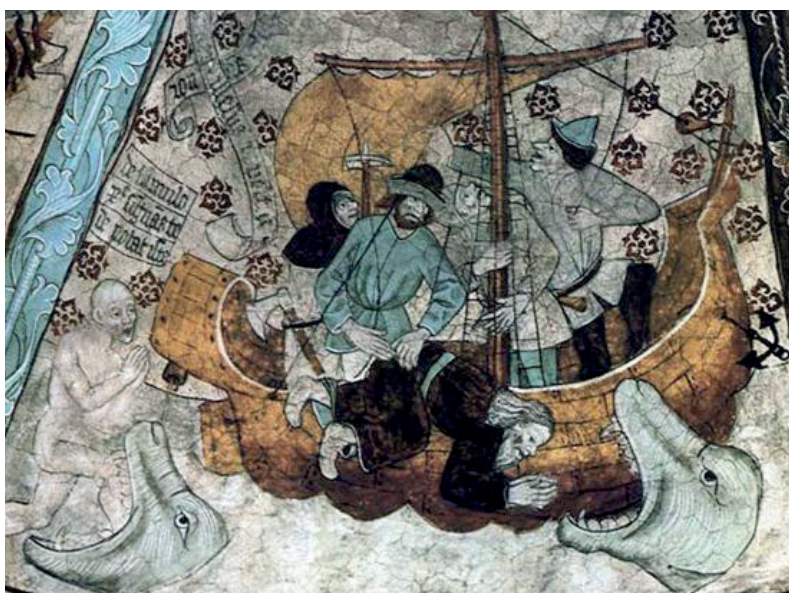
Albertus Pictor, väggmålning från 1400-talet. Härkeberga kyrka.

är yngst i en obetydlig släkt. De tvekar, men inte Jona. Han bara flyr när han blir kallad att predika i Nineve. Han hoppar på en båt som ska åt rakt motsatt håll, men båten råkar i sjönöd. Jona får skulden och blir kastad i havet där han blir slukad av en stor fisk som tre dygn senare kastar upp honom på land. Jona får erfara att det inte går att fly eller gömma sig för Gud.