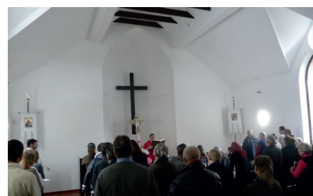
Gudstjänst i Kiev ledd av biskop Horpynchuk.