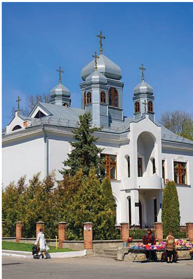
ULC-kyrkan i Kremenets.