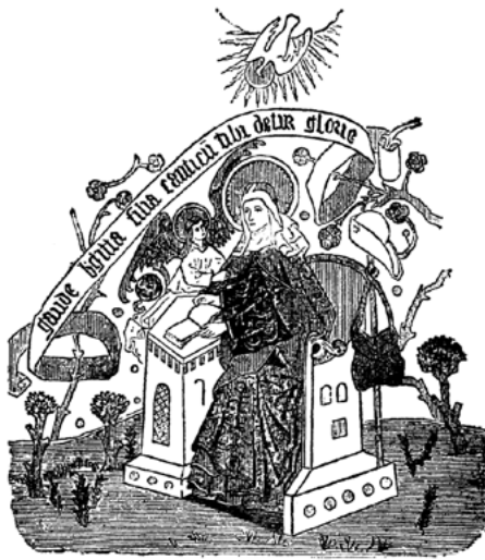
Birgitta mottar uppenbarelser. Illustration i Nordisk familjebok, från medeltiden. Public Domain.

föll ofta i extatisk hänryckning där hon påstod att hon fick gudomliga budskap och kände sig som Kristi brud och speciella språkrör. Boken ”Himmelska uppenbarelser” innehåller en beskrivning av så många som 700 sådana visioner, inklusive Frälsarens klosterregel , en lång och detaljerad ordensinstruktion från Kristus angående klostret som han ville att Birgitta skulle grunda för att hedra Maria. Hon menade