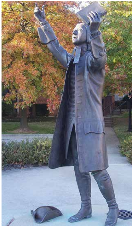
Staty av John Wesley i Wilmore, Kentucky, USA.

läste Luthers förord till Romarbrevet som han till slut fick en stark känsla av att han litade på Kristus allena och att hans synder hade tagits bort. Wesley tolkade denna innerliga känsla och erfarenhet som ett vittnesbörd från den helige Ande som försäkrade honom om att han hade den nödvändiga tron