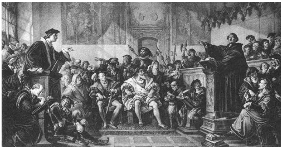
Leipzigdisputationen sommaren 1519 var ett stort offentligt religions-samtal som blev en vändpunkt för den lutherska reformationen.

Det hade gått mindre än två år sedan Martin Luther spikade upp sina 95 teser. Avsikten var inte att starta ett uppror mot påvekyrkan. Luther hade egentligen inte kritiserat kyrkans lära om avlaten, bara det utbredda missbruket i samband med avlatshandeln. Det oväntat starka motstånd han fick ledde till att han behövde fördjupa sig ännu mer i Bibeln. Då upptäckte han gradvis att många av kyrkans läror och lagar var obibliska. Och med den berömda "tornupplevelsen" hösten 1518 eller kanske tidigt 1519 fick Luther klarhet i Skriftens lära om rättfärdiggörelsen genom tron allena, bara av nåd.