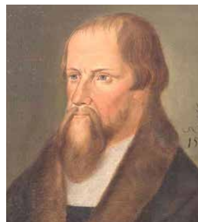
Caspar Cruciger, målat av Lucas Granach den yngre.