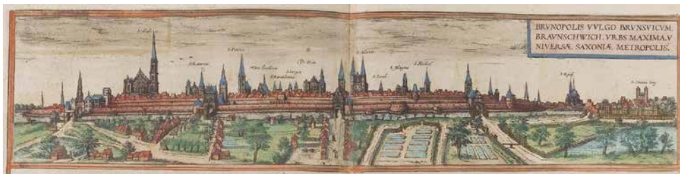
Braunschweig, slutet av 1500-talet.