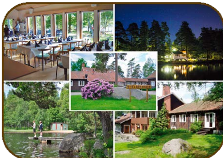
Hjortsbergagården, lägergård mellan Ljungby och Växjö, 8 km från Alvesta