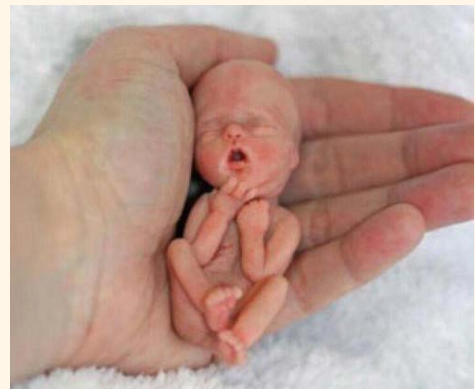
12 veckor gammalt foster

Dina ögon såg mig när jag var ett litet foster. Alla mina dagar blev skrivna i din bok, de var bestämda innan någon av dem hade kommit. (Psalt. 139:13-16)