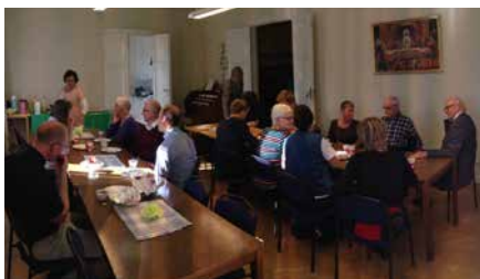
Kyrkkaffe i Norrköping