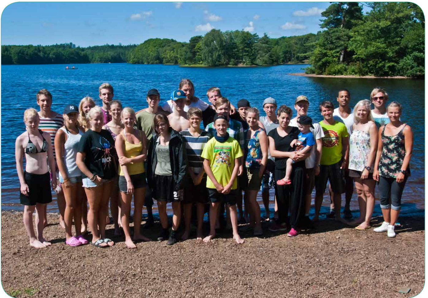
Deltagare i kanotlägret vid Lagans strand

NR 4 2013 – ÅRGÅNG 27. LUTHERSKA BEKÄNNELSEKYRKANS TIDNING