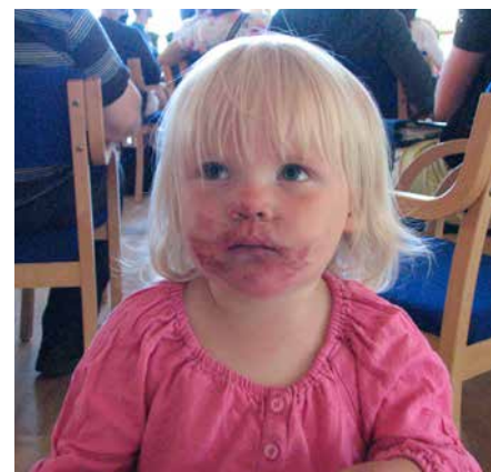
Förlåt, men jag blev lite trött och hungrig så jag smet ut i skogen en stund.