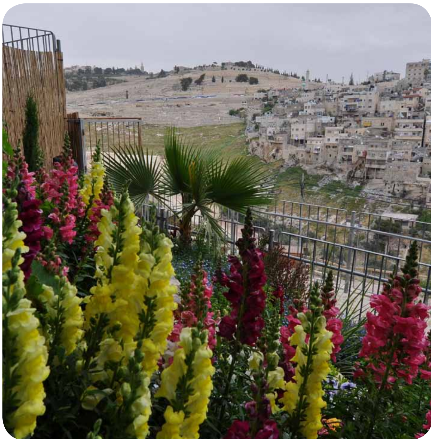
Oljeberget sett från Davids stad.

NR 3 2011 – ÅRGÅNG 25. LUTHERSKA BEKÄNNELSEKYRKANS TIDNING