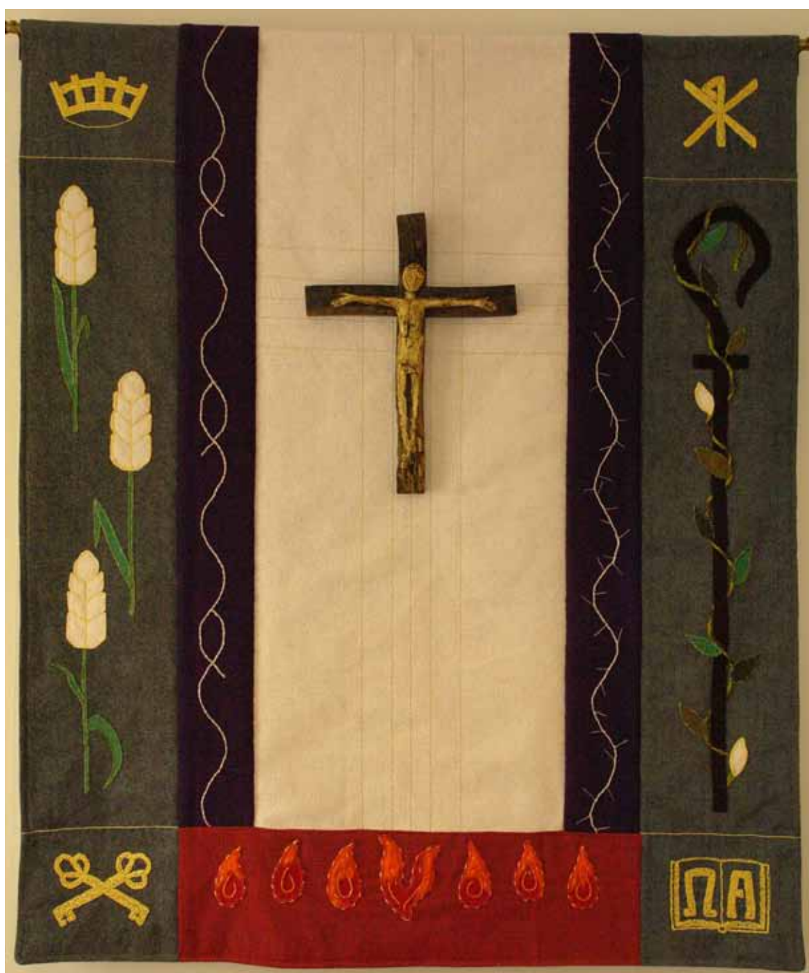
Ny altaronad i Norrköping

NR 2 2011 – ÅRGÅNG 25. LUTHERSKA BEKÄNNELSEKYRKANS TIDNING