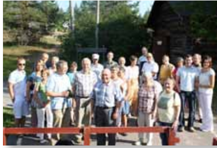
Glada deltagare efter lärosamtal med S:t Johannes församling