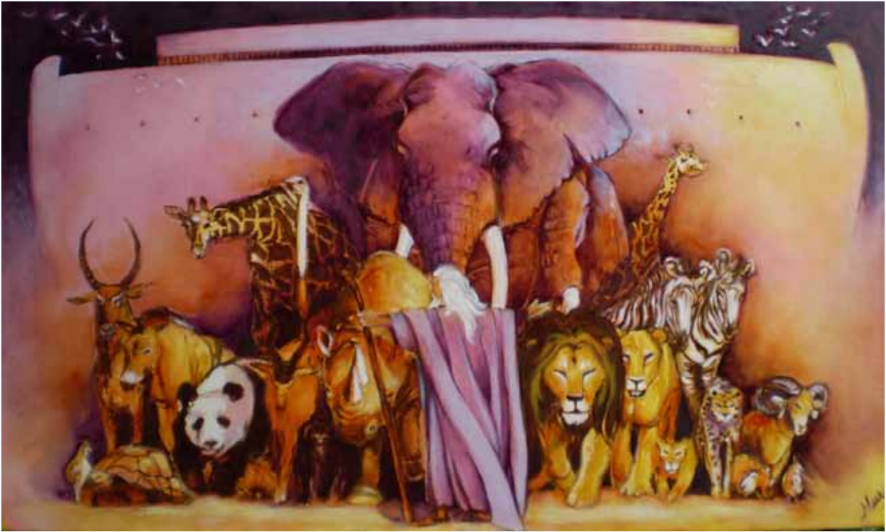
Noas Ark. Olje på lerret (60x100 cm)