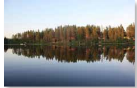
Utsikt från bastun